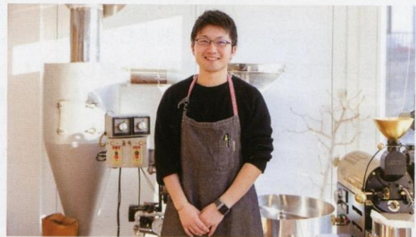
穏やかさの中にも、地元‘日立’を元気にしたいという熱意が伝わってきます。

自らが営むコーヒー専門店‘ただいまコーヒー’を懸け橋に、地域の輪はこれからもますます広がっていきそうです。